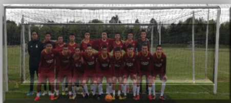
Imagen 2. Equipo de fútbol

Durante el segundo semestre de 2019, se logró consolidar el equipo de futbol, se compararon uniformes y participaron en la Copa POLI. La consolidación del equipo de futbol y la participación en el torneo, se convirtió en una oportunidad para motivar a los estudiantes y generar sentido de pertenencia hacia la institución y el diseño de los uniformes contribuye a la consolidación de la Imagen Institucional.