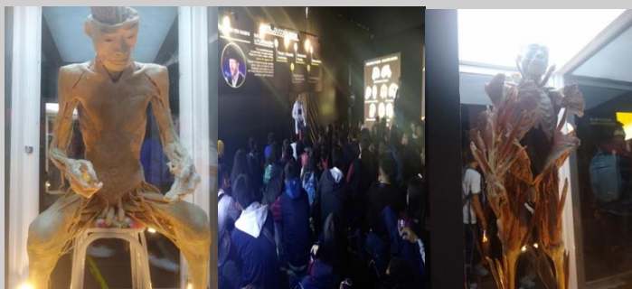
Imagen 1. Salida pedagógica Exposición Bodies

Objetivos Específicos: Adquirir destrezas en la interacción y acercamientos sobre la interacción del cuerpo humano. Determinar la influencia de diversos factores en la interacción del cuerpo humano. Realizar un registro fotográfico de los diferentes lugares visitados con el fin de utilizarlos en la elaboración de un catálogo interactivo. Ver imagen 1.